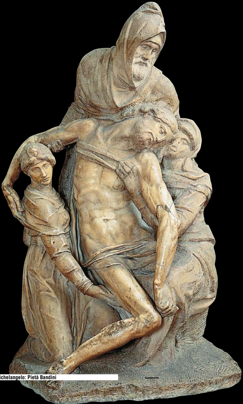
Michelangelo: Pietà Bandini